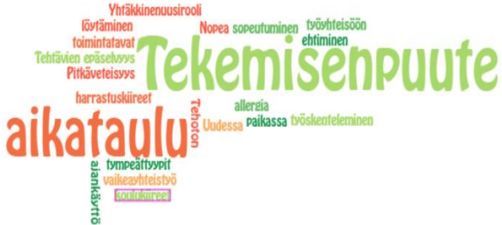
Kuvio. Vapaaehtoistyön kokeilun haastavimmat tilanteet Lahden yhteiskoulun vapaaehtoistoiminnan kurssilasten 2019 mielestä