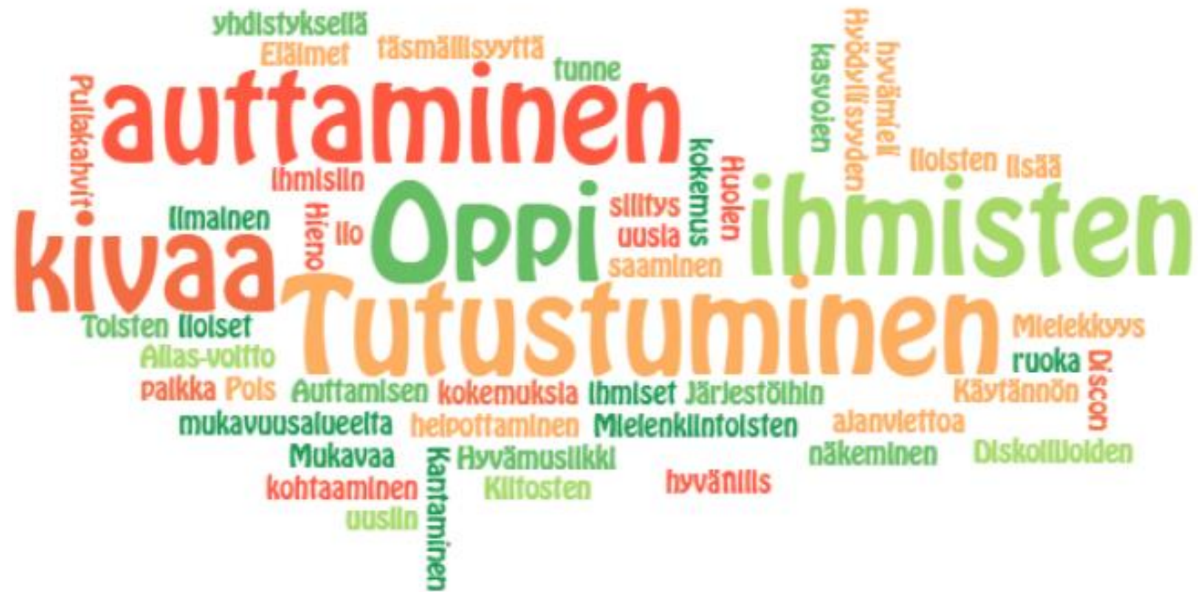
Kuvio. Vapaaehtoistyön kokeilun parhaat kokemukset Lahden yhteiskoulun vapaaehtoistoiminnan kurssilasten 2019 mielestä