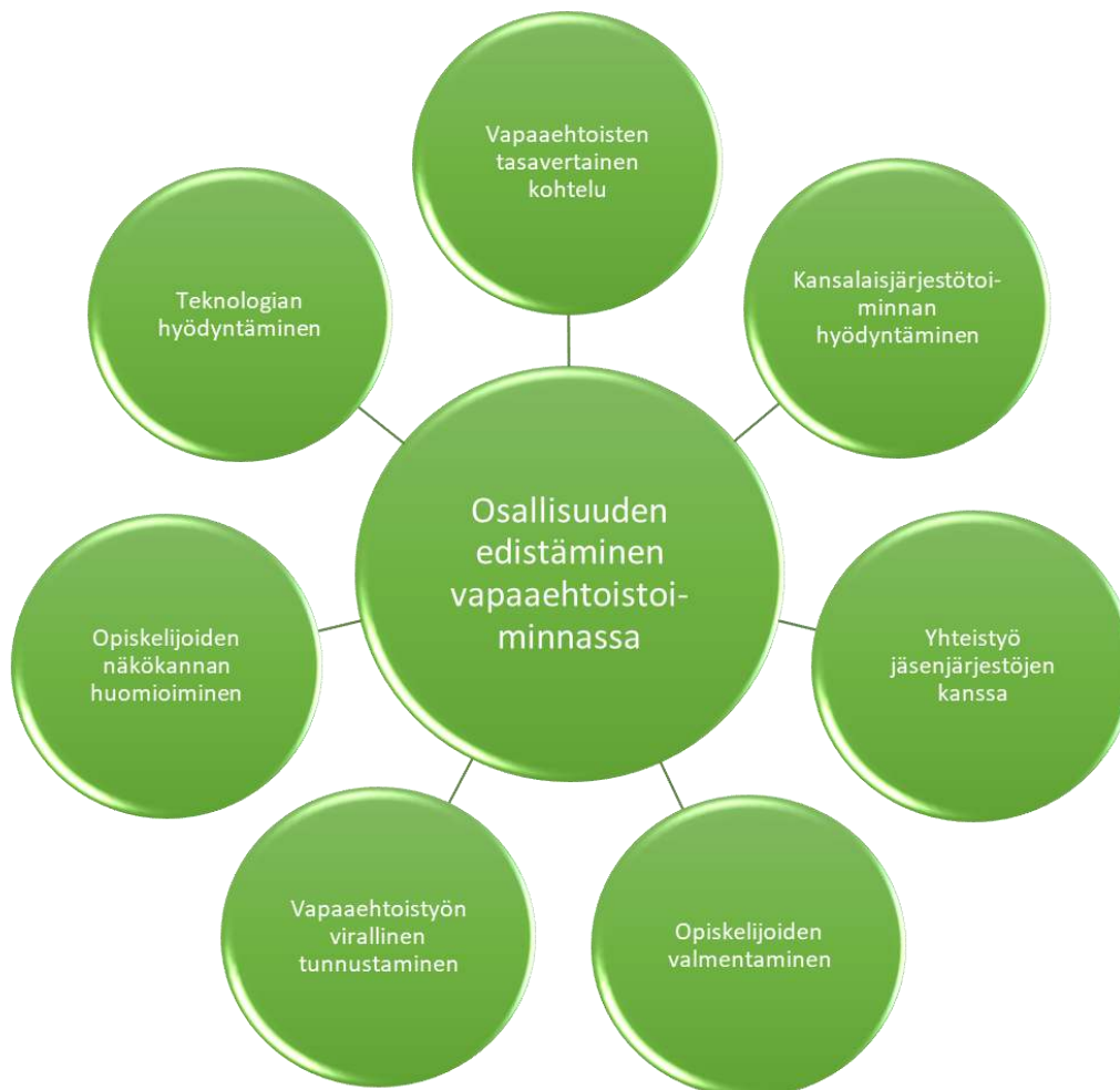
Kuvio 3: 15–18-vuotiaiden opiskelijoiden osallisuuden edistäminen vapaaehtoistoiminnassa

kat vapaaehtoisten tasavertainen kohtelu, kansalaisjärjestötoiminnan hyödyntäminen, yhteistyö jäsenjärjestöjen kanssa, opiskelijoiden valmentaminen, vapaaehtoistyön tunnustaminen virallisesti, teknologian hyödyntäminen ja opiskelijoiden näkökannan huomioiminen.