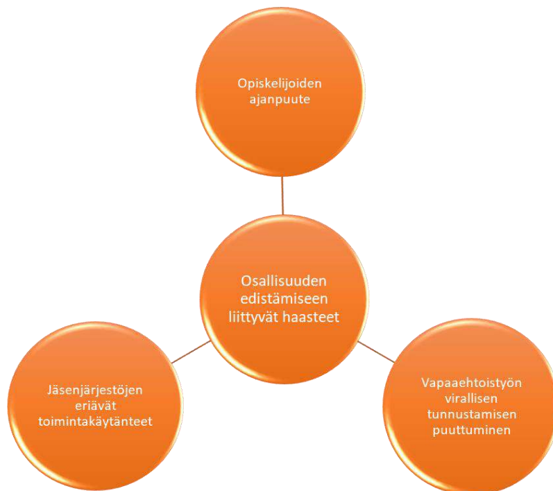
Kuvio 4: 15–18-vuotiaiden opiskelijoiden osallisuuden edistämiseen liittyvät haasteet

Aineiston analyysin tuloksena muodostui kolme alaluokkaa, joita ovat vapaaehtoistyön virallisen tunnustamisen puuttuminen, opiskelijoiden ajanpuute ja jäsenjärjestöjen eriävät toimintakäytänteet. Nämä alaluokat kuvaavat 15–18-vuotiaiden opiskelijoiden osallisuuden edistämiseen liittyviä haasteita vapaaehtoistoiminnassa.