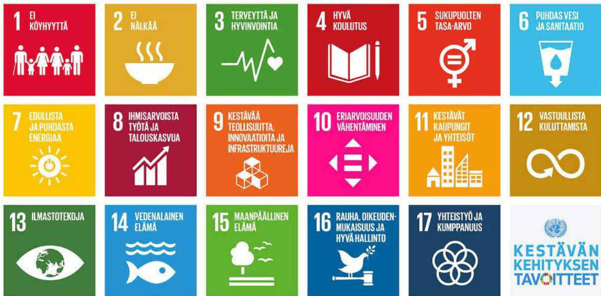
YK:n Agenda 2030 -toimintaohjelman kestävän kehityksen tavoitteet.

Tavoitteet ovat samat maailman kaikille maille, mutta ne painottuvat eri tavoilla riippuen maan kehitystasosta. Vastuu tavoitteiden saavuttamisesta on maiden hallituksilla, ja hallitukset ovat sitoutuneet luomaan kansalliset toimintasuunnitelmat tavoitteiden saavuttamiseksi.